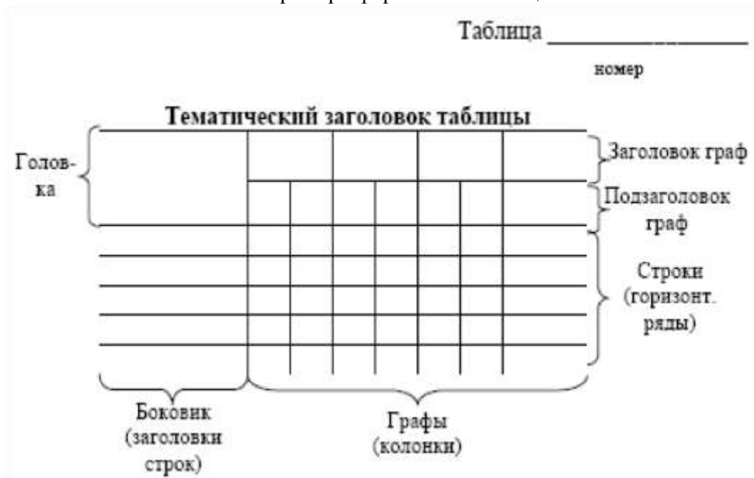
Рисунок 1. Структура таблицы