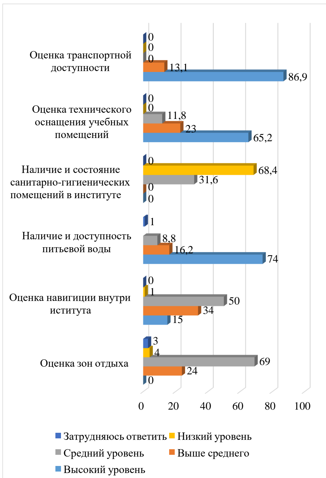
Рисунок 2 – Результат опроса- тестирования удовлетворенности студентов оценки уровня комфортности

неввысокая, однако находится в зоне высоких и средних показателей: от 86,9 до 65,2 %.